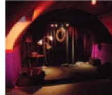
Le Méphisto, un cadre intimiste idéal pour la musique acoustique. (DR)

Cette démarche favorise la rencontre entre les différents acteurs de la scène régionale, avec à la clé parfois, la création de groupes qui font ensuite un beau parcours dans le panorama musical national. La soirée permettra également aux musiciens moins confirmés de faire leurs armes et, pourquoi