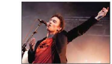
Ce samedi 2 avril à la D'zine, l'artiste K sera la tête d'affiche de la soirée de soutien à Fully Bouge.

Ce samedi 2 avril, dès 20 heures à la D'zine, se fera gracieusement mise à disposition de l'AsoFy par l'Association de la Belle Usine, aura lieu une soirée de soutien à Fully Bouge. Au programme, apéritif garni et dégustation de vins de la région. Dès 21 heures, place à la musique. Jacko, seul avec sa guitare et sa voix rocailleuse, chauffera la salle avec son style incontestable, mêlant musique en duo avec des textes vengés et imaginaires.