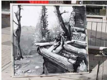
Les tableaux réalisés par des graffeurs seront exposés, à l'intention de tous les publics, à la belle Usine de Fully.

FULLY Grillade estivale de l'AsoFy. L'AsoFy (Action socio-culturelle de Fully) met sur pied une grillade estivale le jeudi 18 août, dès 11h, à la Châtaignerie de Fully. Programme avec le Foyer Sœur Louise Bron: pétanque, animation, apéro, grillade et salade. Prix 20.- par adulte et 8.- par enfant (à payer sur place). Seniors et familles bienvenues. Inscriptions obligatoires jusqu'au 11 août à l'AsoFy au 078 827 96 86 ou par mail à asofy@fully.ch .